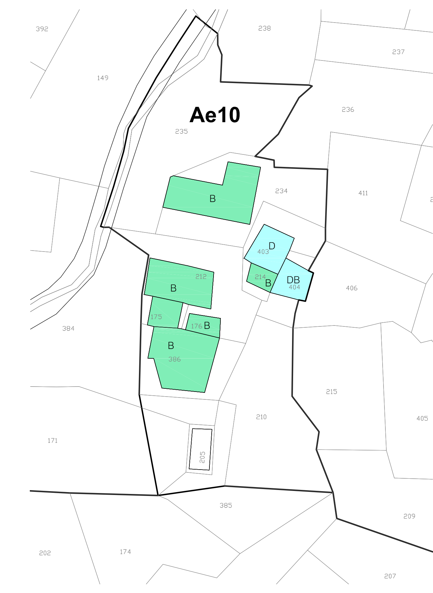
ZONA Ae10 - LE PLAN-PRAZ Planimetria su base catastale con individuazione della zona di PRG Foglio XXIII - scala 1:1000

Regione Autonoma Valle d'Aosta Région Autonome Vallée d'Aoste Comune di Rhêmes-Saint-Georges PIANO REGOLATORE GENERALE ADEGUAMENTO DEL PRGC AL PTP (ART. 13 L.R. 6 APRILE 1998, N. 11) Cartografia Prescrittiva P4C6 CLASSIFICAZIONE DEGLI EDIFICI NELLE SOTTOZONE DI TIPO A Ae9 - Le Mougnoz Ae10 - Le Plan-Praz scala 1:1000/1:500 Febbraio 2017 Tecnici incaricati: Arch. Franco Manes [coordinatore] Arch. Andrea Marchisio Arch. Michèle Saulle Dott. Gioglio Roby Vuillemoz Dott. Forestale Italo Cerise Adottato dal Consiglio Comunale con deliberazione n° Approvato dalla Giunta Regionale con deliberazione n° In data In data