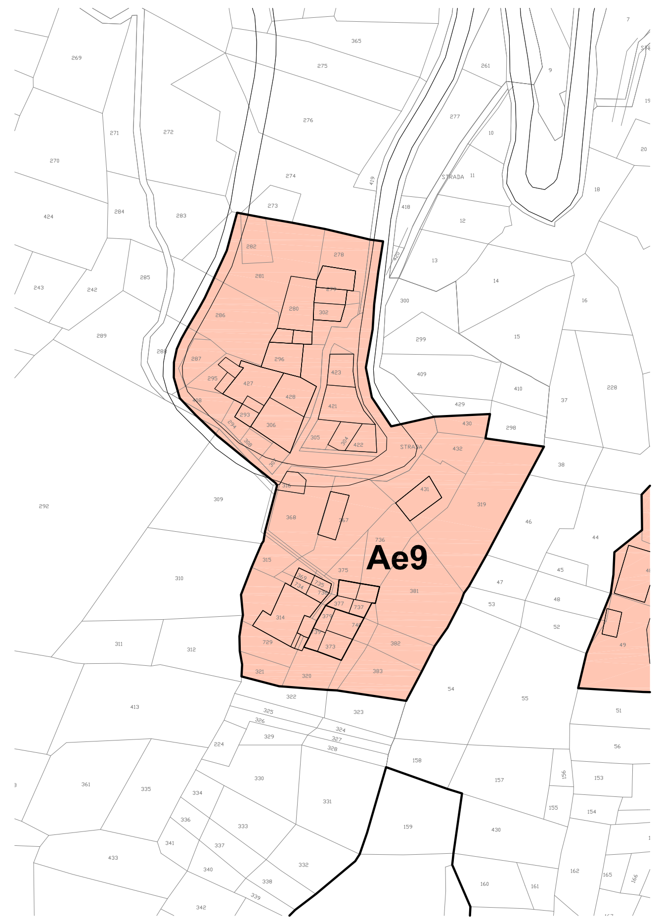
ZONA Ae9 - LE MOUGNOZ Classificazione Foglio XXIII - scala 1:500